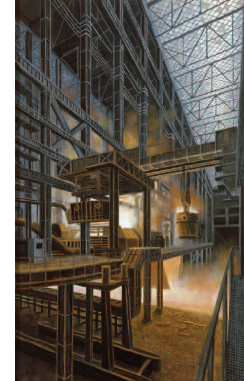
Acierie , 2010, pastel sur papier, 150 x 100 cm (x 3)