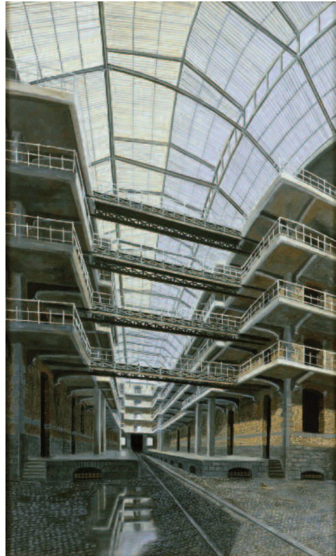
Au recto : Grand Palais 3 , 2008, pastel sur papier, 160 x 100 cm (x 3)

A travers cette exposition l'artiste nous invite dans son univers particulier, un monde étrange, nostalgique, d'où se dégage toute la poésie de lieux abandonnés, désertés, silencieux. Dans ses grands pastels, elle s'attache à réinventer ces espaces, à créer des architectures idéales.