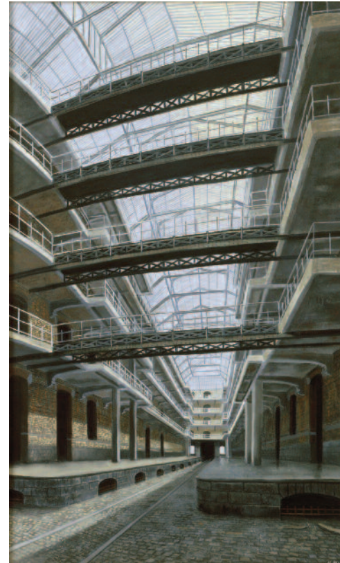
Tour et Taxis 5 , 2004, pastel sur papier, 140 x 100 cm (x 3)